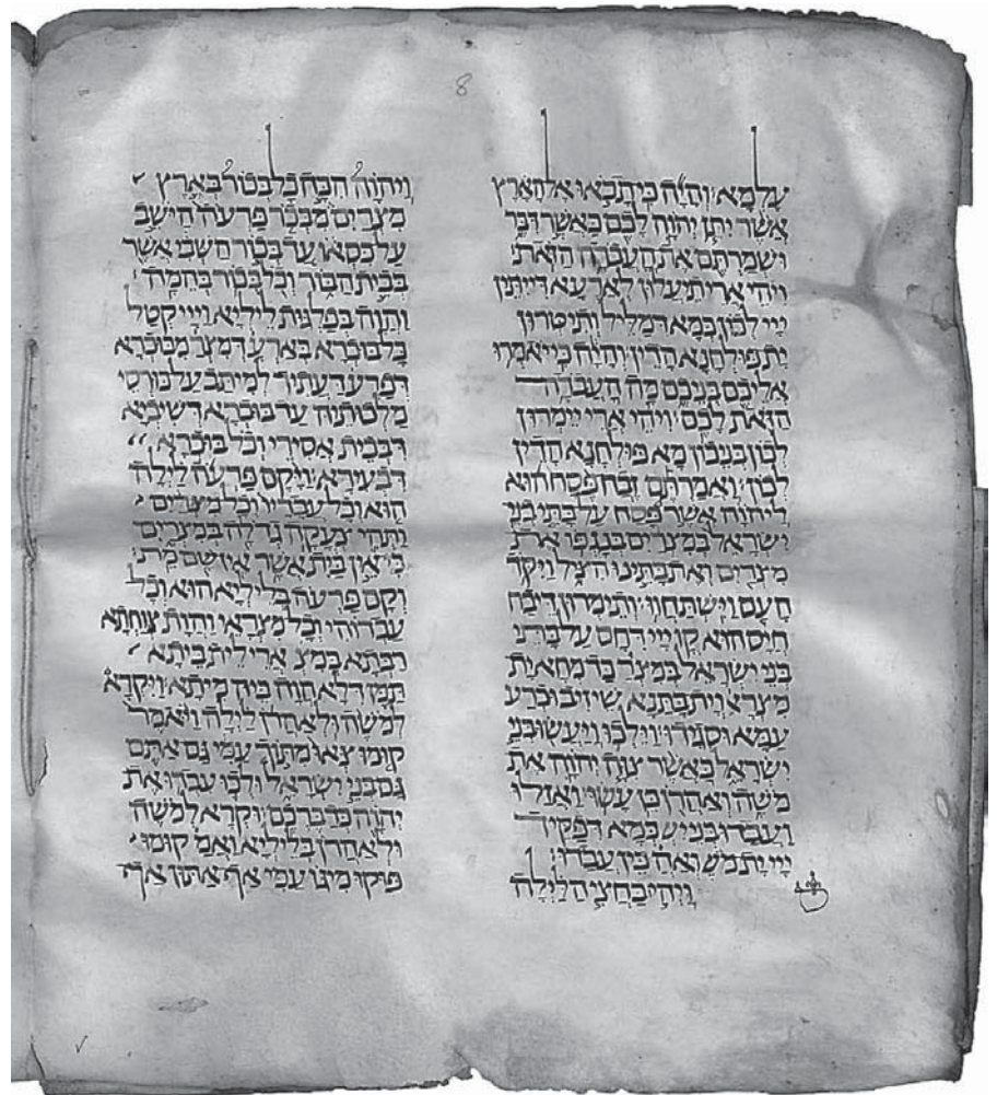
Pagina uit Hebreeuwse bijbel

Zijn afscheidsrede had dezelfde titel als het eerste hoofdstuk van dit boek, namelijk: 'Het Oude Testament bestaat niet.' Ik ken die rede verder niet, maar ik neem aan dat de inhoud veel te maken heeft met zijn boek. In het boek blijkt zijn grote belesenheid en ervaring op het gebied van de Oudtestamentische wetenschap. Van bijna veertig jaar professionele en op den duur ook professorale omgang met het Oude Testament wordt de balans opgemaakt. In talloze noten blijkt zijn grandioze belesenheid. Vlak voor het eind van zijn actieve dienst in Kampen kreeg hij voor dit boek ook nog een jaar vrij dankzij een subsidie van de NWO (Nederlandse Organisatie voor Wetenschappelijk Onderzoek). Ik zou hoogleraren onder ons (Kampen, Broederweg) t.z.t. graag hetzelfde 'sabbatsjaar' toewensen!