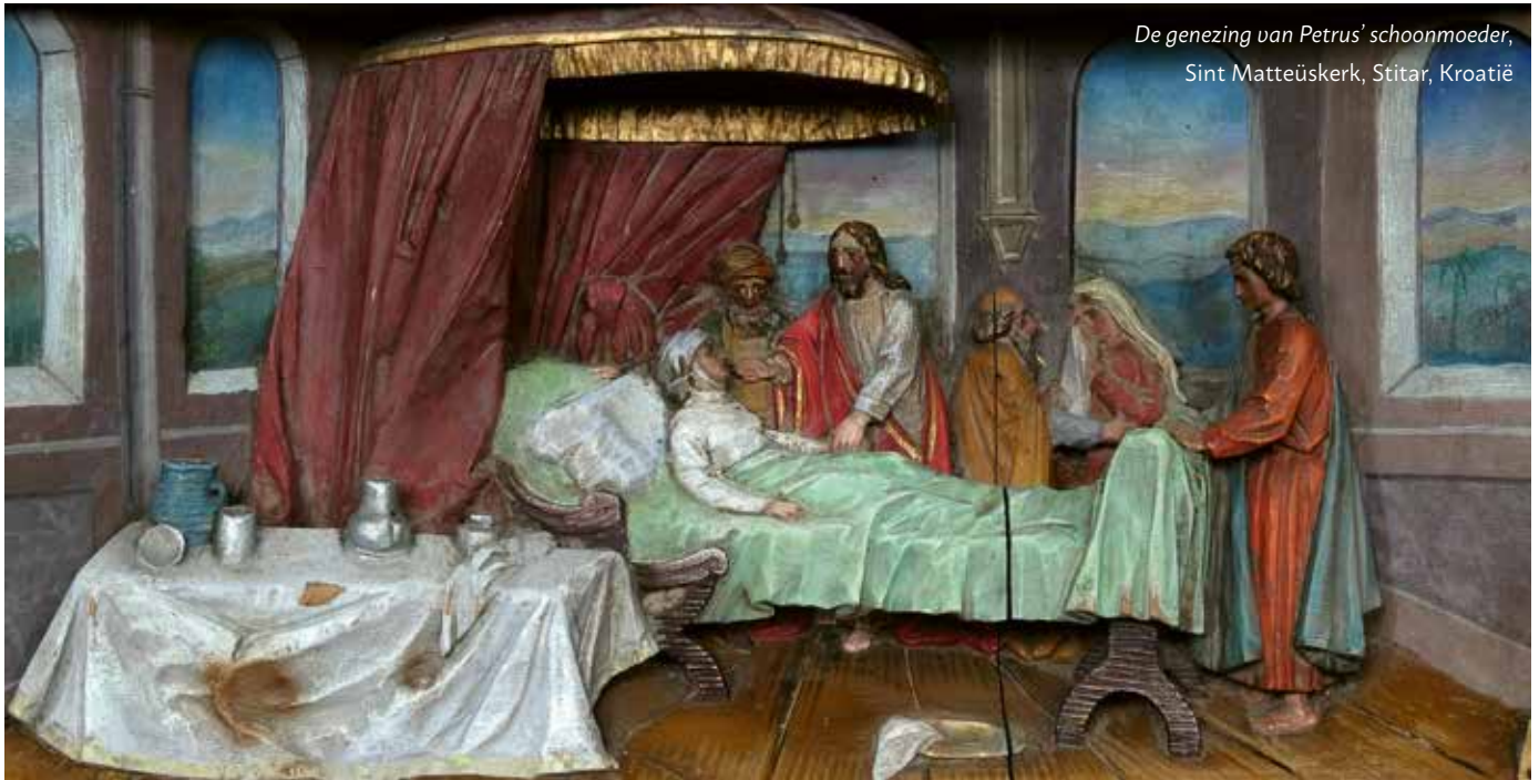
De genezing van Petrus' schoonmoeder, Sint Matteüskerk, Stitar, Kroatië