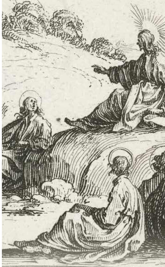
Jacques Callot, Bergrede (detail)