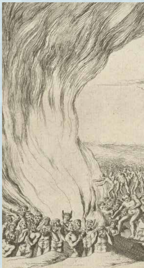
Gillis van Scheyndel, Verdoemden naar de hel geleid (detail)