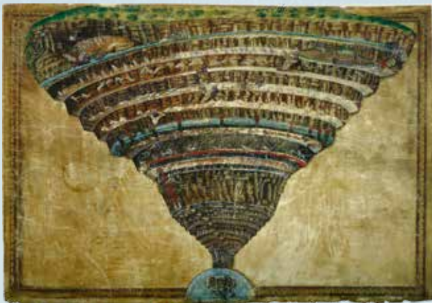
Botticelli, Kart van de hel