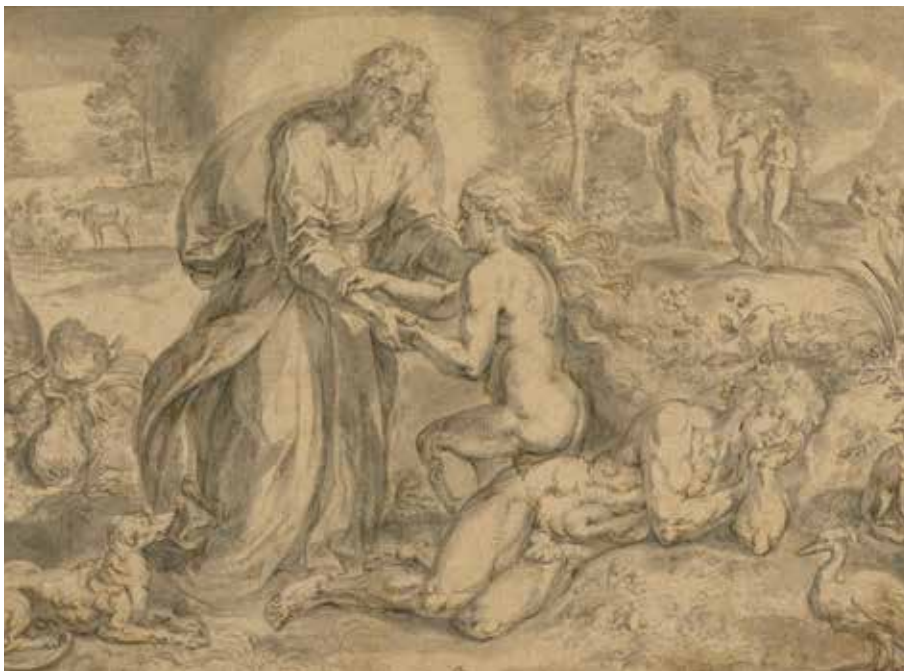
Chrispijn van den Broeck, De schepping van Eva

roeping in soms ongelijke verantwoordelijkheid of positie gehoorzaam te volgen (Hand. 2; 1 Kor. 14:26-40; 1 Kor. 11:1-16; Ef. 5; Kol. 3; 1 Petr. 3:1-12).