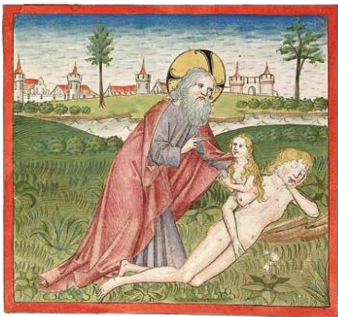
De schepping van Eva, 15e-eeuws manuscript

God af te wenden, achter de afgoden aan. Of het is een belofte van God aan zijn terugkerende volk: vrouwen zullen zwanger zijn van (krachtige) zonen. Ze omvatten hen met hun lichaam. Of het ziet op de vernietiging van Israël door de Babyloniërs: Israëlitische mannen zijn zo onmachtig dat de vrouw de (vechtende) man moet omvatten om hem te beschermen – de wereld op zijn kop. Enzovoort. Welke uitleg moet je volgen? Een vergeten tekst? Eerder een tekst die je niet zo maar voor je karretje zou moeten spannen.