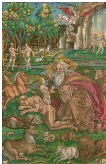
Lutherbijbel, Wittenberg, 1551: Het paradijs