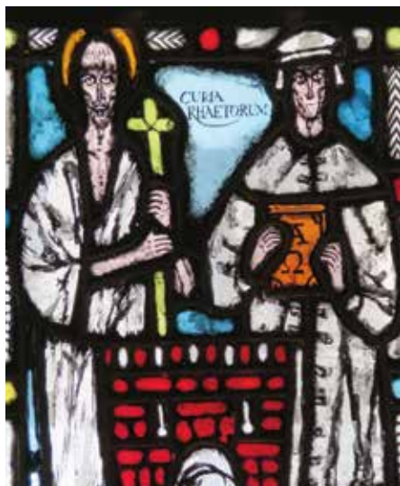
Lucius en Comander