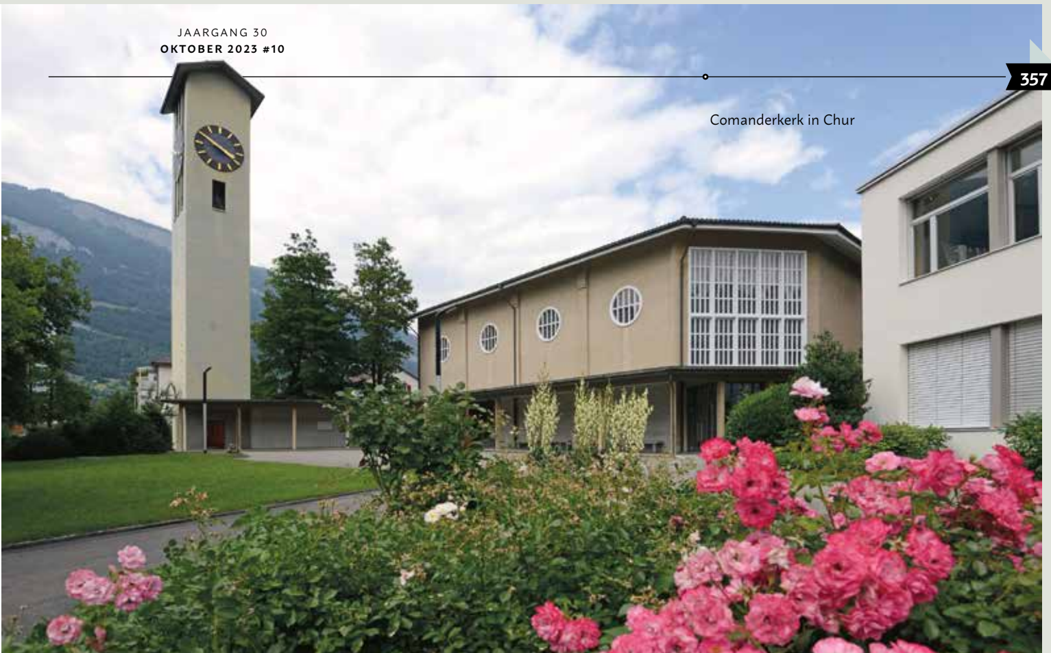
Comanderkerk in Chur