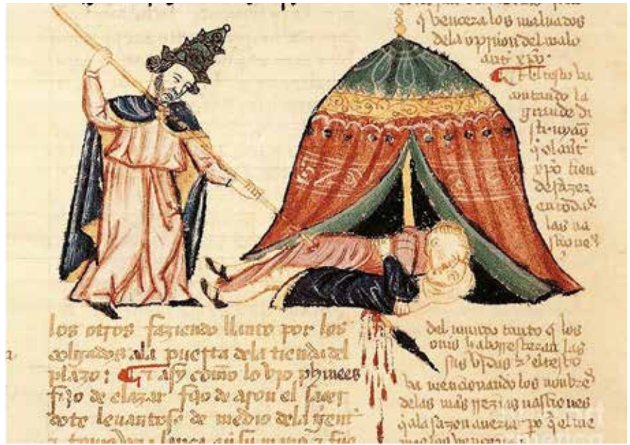
De ijver van Pinechas, uit de Alba Bijbel, vijftiende-eeuws manuscript

In het Oude Testament treft God meer dan eens vele Israëlieten met de dood. Dat roept vragen op, zeker als Gods ingrijpen verbonden wordt met zijn jaloezie.