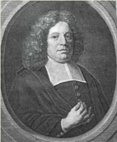
Wilhelmus à Brakel

te zijn, maar dan in het kader van de gezonde gereformeerde leer. Het was bevindelijk en gereformeerd.