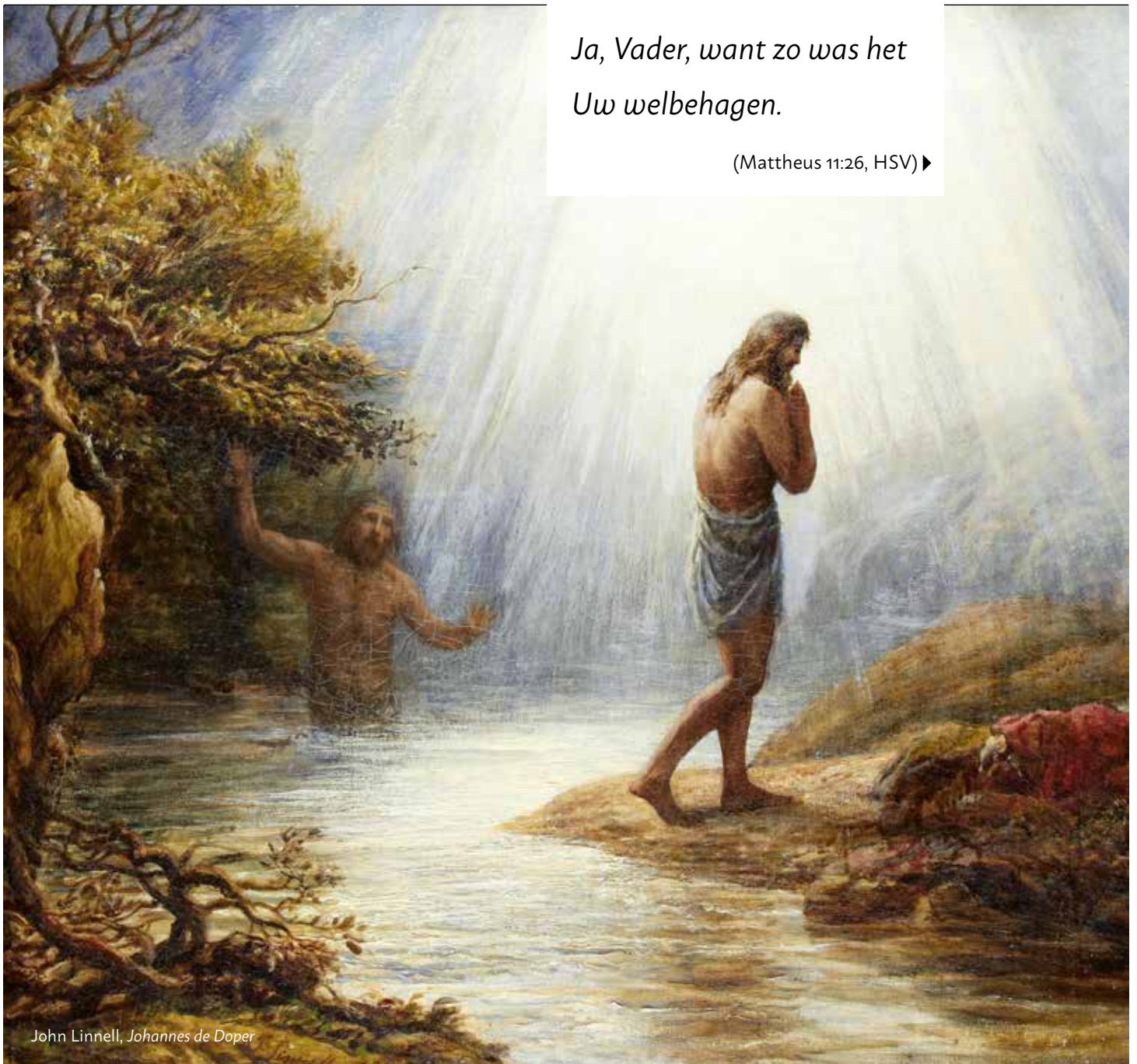
John Linnell, Johannes de Doper