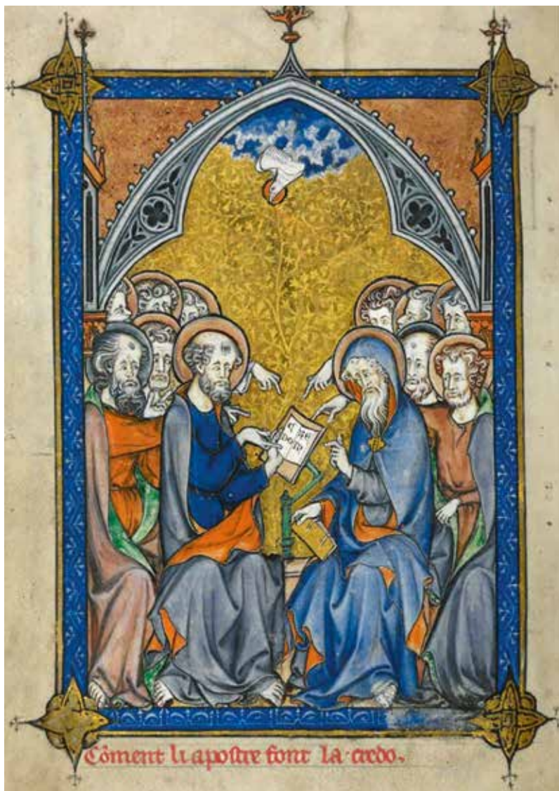
De twaalf apostelen met het Credo, manuscript, 13e eeuw

De Bijbel laat op allerlei plaatsen zien hoe leer en leven bij elkaar horen. Paulus maakt dat bijvoorbeeld duidelijk aan Timoteüs in zijn eerste brief. Hij geeft Timoteüs de opdracht mee om sommigen te bevelen 'geen andere leer te onderwijzen' (1 Tim. 1:3), en even verderop zegt hij wat het doel van deze opdracht is: '... de liefde die voortkomt uit een rein hart, een goed geweten en een ongeveinsd geloof' (1 Tim. 1:5). In zijn tweede brief aan Timoteüs draagt Paulus hem op om onderwijs te geven vanuit de Schriften, omdat die nuttig zijn om op te voeden tot een rechtchapen leven, zodat een dienaar van God voor zijn taak berekend is en voor elk goed doel volledig is toegerust (2 Tim. 3:16-17).