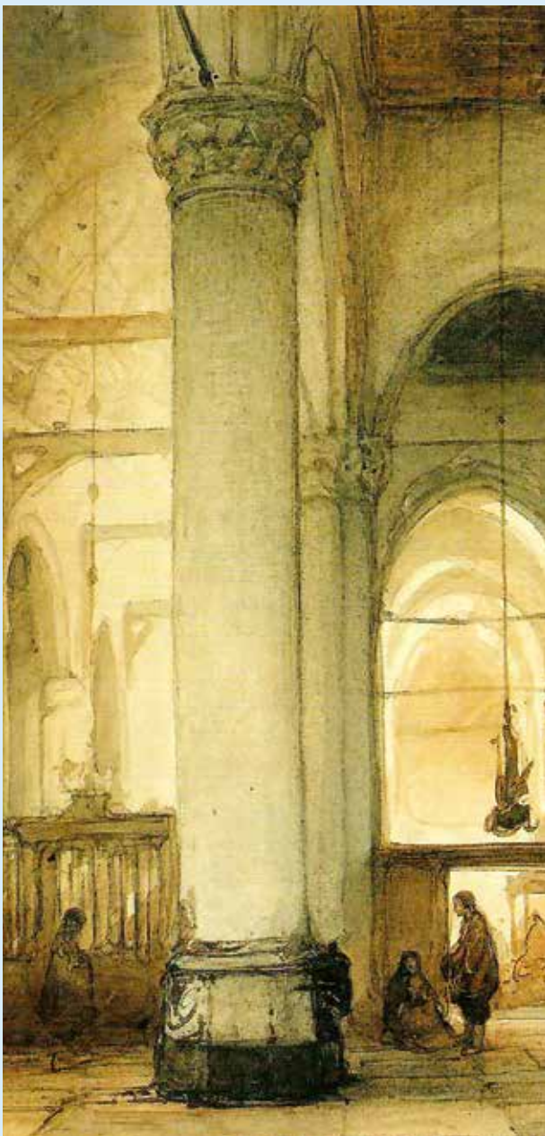
Johannes Bosboom, Kerk van Arnhem (detail)

In de toekomstige kerkorde en het nieuwe bindingsformulier van de toekomstige NeGK wordt hoog opgegeven van Gods Woord, 1 maar het gezag van de gereformeerde belijdenis wordt (vaak) in het midden gelaten. Wat zit daarachter?