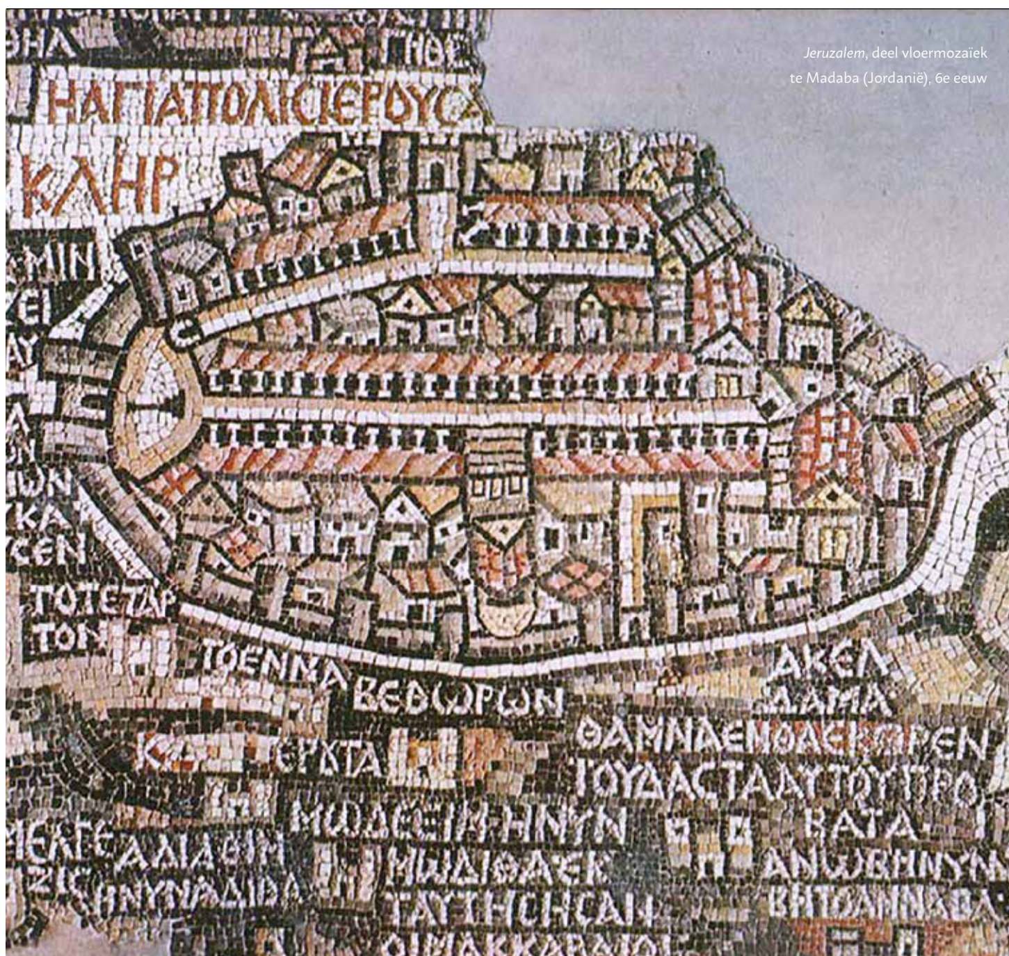
Jeruzalem, deel vloermozaïek te Madaba (Jordanië), 6e eeuw