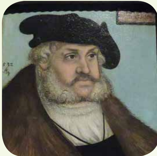
Frederik de Wijze, Lucas Cranach

een kan fris Einbecker bier aanrukken, die Luther dankbaar accepteerde. Keurvorst Frederik van Saksen liet nog niets merken van erkentelijkheid tegenover Luther, maar aan zijn secretaris Georg Spalatinus liet hij zijn waardering wel merken: 'Hoe goed heeft pater doctor