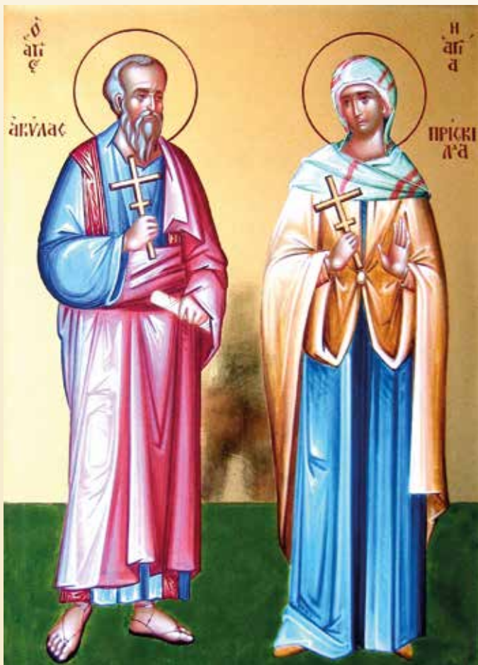
Priscilla en Aquila

De synode heeft ook aan een echt-paar gerefereerd dat in Romeinen 16:3 wordt genoemd, namelijk Priscilla en Aquila. Dit christelijke paar had Apollos in Efeze apart genomen 'en zij legden hem uit wat de Weg van God precies inhield' (Hand. 18:26). Dit was duidelijk privé-instructie en geen officieel kerkelijk werk. Priscilla nam geen deel aan het onderwijs aan Apollos als vrouwe-