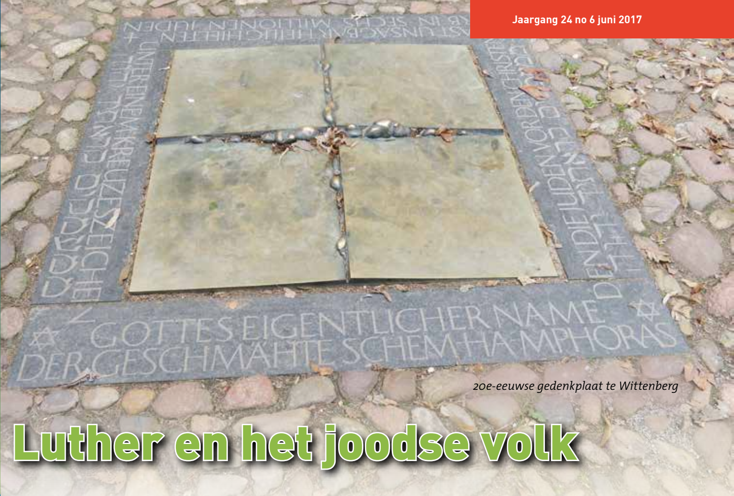
20e-eeuwse gedenkplaat te Wittenberg