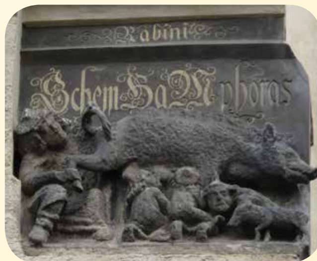
De 'Judensau' te Wittenberg

Hoe kwam Luther nu van zijn aanvankelijke 'vriendelijke' houding tot zijn latere antisemitische uitspraken? Hoe kon zijn houding in haar tegendeel veranderen? Er bestaat geen eenvoudig antwoord op deze vragen, we beschikken wel over aanwijzingen.