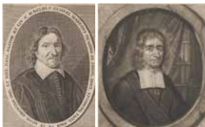
Samuël Maresius (links) en Balthazar Bekker