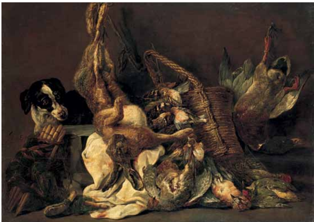
Jan Fijt, Dood wild met jachthond (© State Hermitage Museum, St Petersburg)

De eerste is de Hongaar Gyula Somos, die een deel van het jaar in Nederland verblijft om te doceren aan de Wackers Academie voor figuratieve kunst. Van hem is een aantal kleine stillevens te zien die het bekijken waard zijn, maar die er ook om vragen goed bekeken te worden. Want achter de precieze,