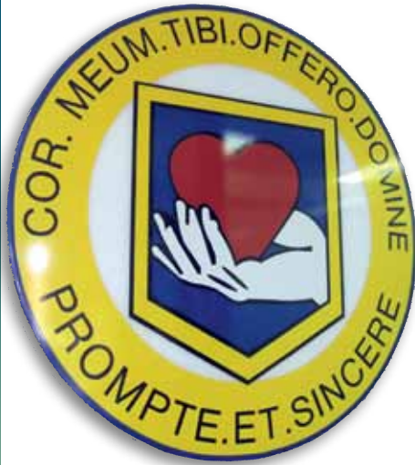
Zegel Calvin, tevens logo van de John Calvin schools in West-Australië

Hoe zagen de gereformeerden dat in de tijd dat de Nederlandse Geloofsbelijdenis werd geschreven? Was hun visie dat ze in een christelijke wereld leefden? Vonden ze dat het mooi zou zijn als die christelijke wereld versterkt zou worden met wat calvinistisch vuur? Nee, hun visie was dat ze woonden tussen mensen die Christus niet kenden. Hun visie was dat de gereformeerde kerk het evangelie moest verkondigen. Waar het evangelie niet wordt gepreikt, is heidendom, zei Luther (ook al uit ervaring).