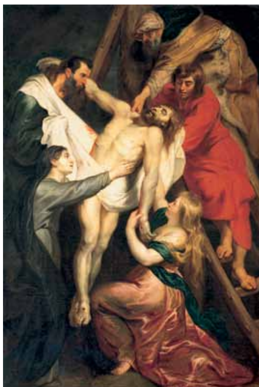
Peter Paul Rubens, Kruisafneming

eigen Gouden Eeuw, een periode van welvaart met een grote artistieke productie. Ze kreeg echter te maken met politieke en religieuze tegenstellingen die uitliepen op de Beeldenstorm van 1566. De daaropvolgende decennia werden getekend door de strijd van de