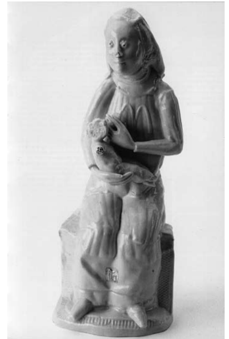
Philip Eglin, Madonna and Child, 2000

Datzelfde kan gezegd worden van Ushering in Banality van Jeff Koons, een paar houten cherubijntjes die een varkentje voortduwen. Het lijkt erop dat deze kunst niet zozeer gemaakt is om te verwijzen naar het heilige, maar dat het heilige gebruikt wordt om dingen aan de kaak te stellen, zoals onze overmatige consumptie of de wegwerpcultuur. Een collega en bewonderaar van Eglin schreef over zijn madonna's: 'Oneerbie-