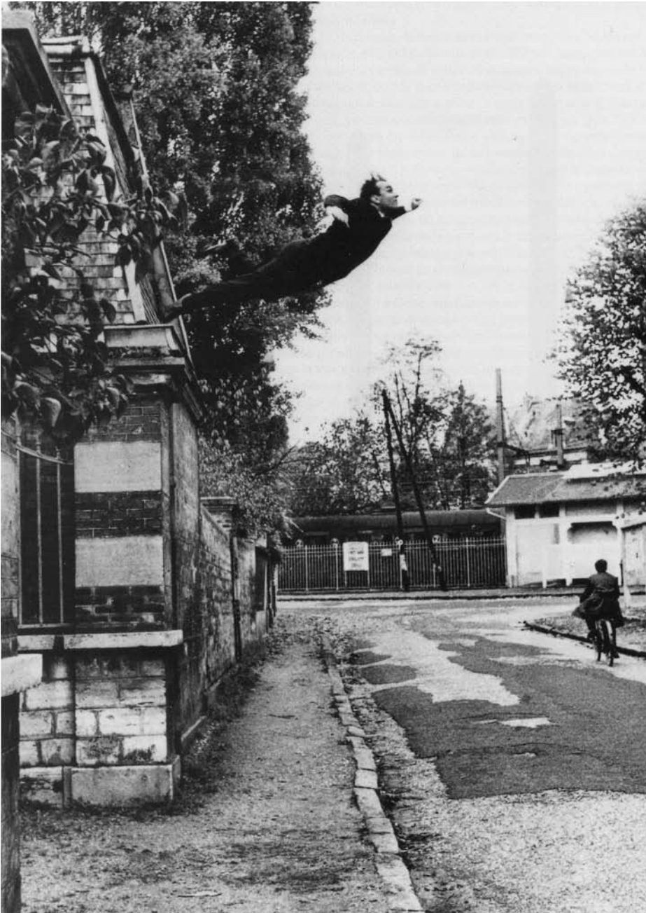
Yves Klein, Sprong in de leegte , 1960

leegte probeerde hij gestalte te geven door diepblauwe monochrome doeken, waarvan er een in Amsterdam hangt.