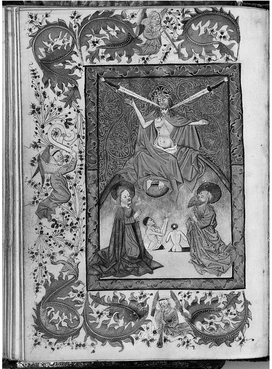
Laatste oordeel, een pagina uit de Haarlemse Bijbel

Er is een hel, een plaats van buitenste duisternis. Er zijn mensen die voor eeuwig verloren zullen gaan. Zonder