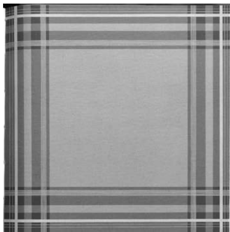
Daan van Golden, Compositie met blauwe ruit , 1964

voorbijgaan. Totdat het me opviel dat die zakdoek ongelofelijk zorgvuldig was geschilderd, met meer intensiteit en perfectionisme dan een zakdoek eigenlijk waard was. Of niet? Dat schilderij had de kwaliteit dat het zonder dat je er erg in had een meditatief nadenken over kunst, en over kunst en leven tot stand bracht. ... Het werk was een opwekker van overwegingen, zoals middeleeuwse kunstvoorwerpen voor particuliere devotie dat kunnen zijn. 3 Spiritualiteit wordt zo wel een heel breed begrip.