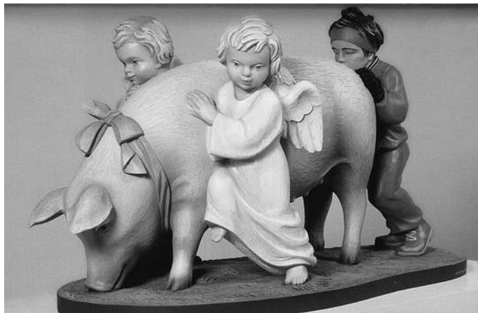
Jeff Koons, Ushering in Banality , 1988

voorbijgaan. Totdat het me opviel dat die zakdoek ongelofelijk zorgvuldig was geschilderd, met meer intensiteit en perfectionisme dan een zakdoek eigenlijk waard was. Of niet? Dat schilderij had de kwaliteit dat het zonder dat je er erg in had een meditatief nadenken over kunst, en over kunst en leven tot stand bracht. ... Het werk was een opwekker van overwegingen, zoals middeleeuwse kunstvoorwerpen voor particuliere devotie dat kunnen zijn. 3 Spiritualiteit wordt zo wel een heel breed begrip.