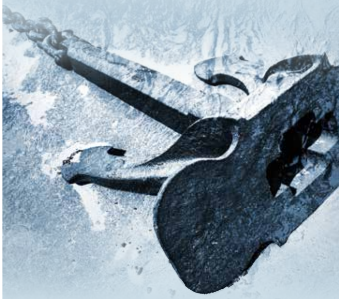
Het krabbende anker

Het concept opent met een nieuw artikel. 'De kerken bestaan dankzij Gods genade. Zijn Geest verbindt de kerken in één geloof: het geloof in Christus Jezus, de Zoon van God.' Dat klinkt wel goed. Alleen: wat bedoel je met 'geloof'? Kan dat hier ook zomaar de persoonlijke geloofsrelatie aanduiden met de focus op de persoon van Jezus Christus? Vijf jaar geleden gaven de GKv nog aan onderling verbonden te zijn 'in eenheid van het christelijk geloof, in gehoorzaamheid aan de Heilige Schrift' (Kerkorde 2014, verder KO2014). Dat sluit nauw aan bij zondag 21 van de catechismus: als Zoon van God (let hier op zijn hemelse majesteit!) vergadert Jezus zich een gemeente, in de eenheid van het ware geloof door zijn Geest en Woord. De werkgroep verwijst in de Toelichting (p. 6) wel naar deze catechismuszondag, maar in de uitwerking vervagen essentiële elementen: Jezus Christus als de 'initiator' van zijn gemeente is uit beeld; ook ontbreekt dat de Geest de eendracht schept door middel van het Woord en de gehoorzaamheid daaraan (Rom. 1:5). Daardoor lijkt 'geloof' in de nieuwe tekst niet meer aan te duiden dan de persoonlijke geloofsrelatie met de focus op de persoon van Jezus Christus. Gereformeerde kerken, gebonden aan de persoon van Jezus Christus, weten zich vanouds óók gebonden aan het geheel van zijn onfeilbare openbaring als het Woord van Hemzelf. Het primaire kenmerk van een echte kerk is daarom dat 'men zich richt naar het zuivere Woord van God, alles wat daarmee in