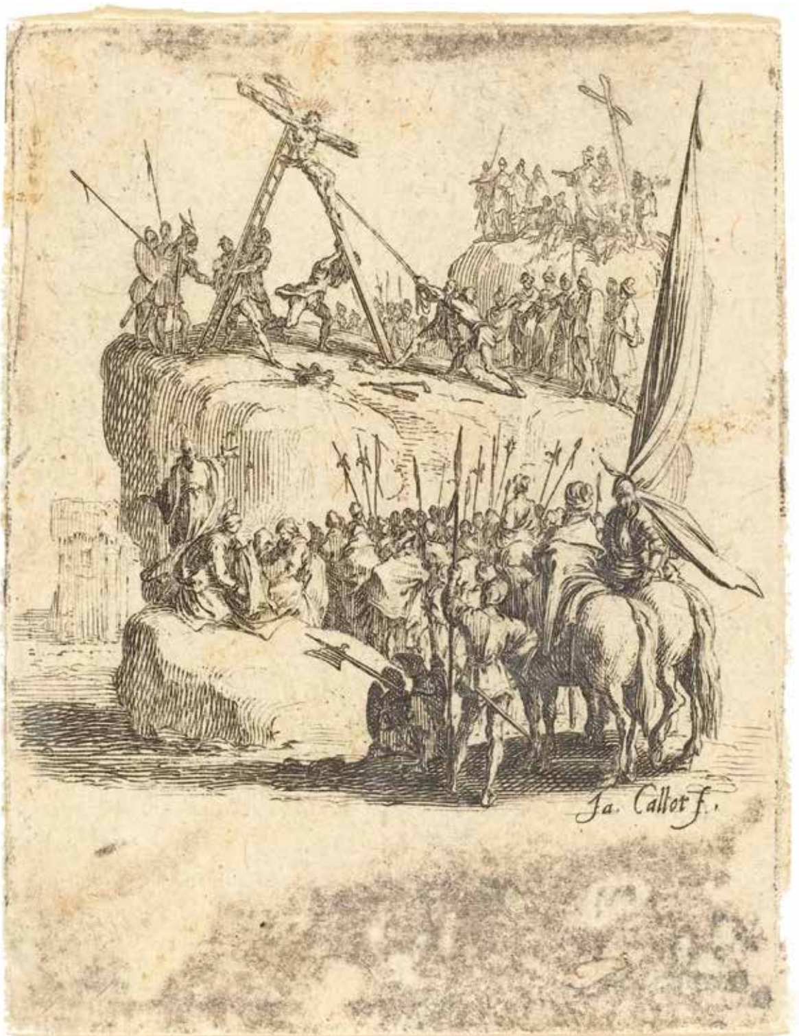
Jacques Callot, De kruisoprichting