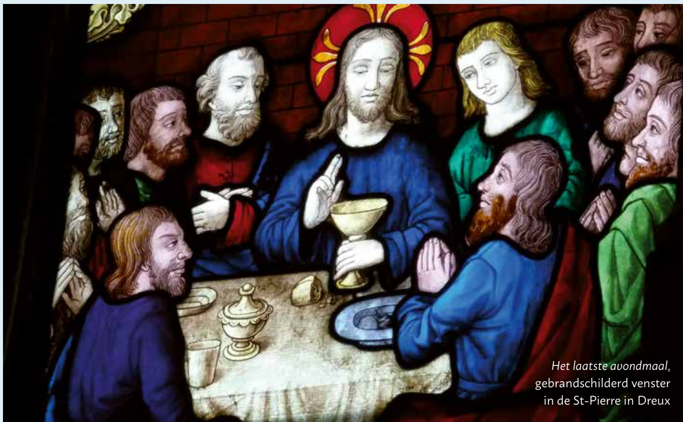
Het laatste avondmaal, gebrandschilderd venster in de St-Pierre in Dreux