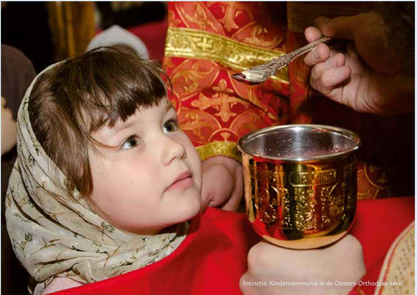
Intinctie. Kindercommunie in de Oosters-Orthodoxe kerk