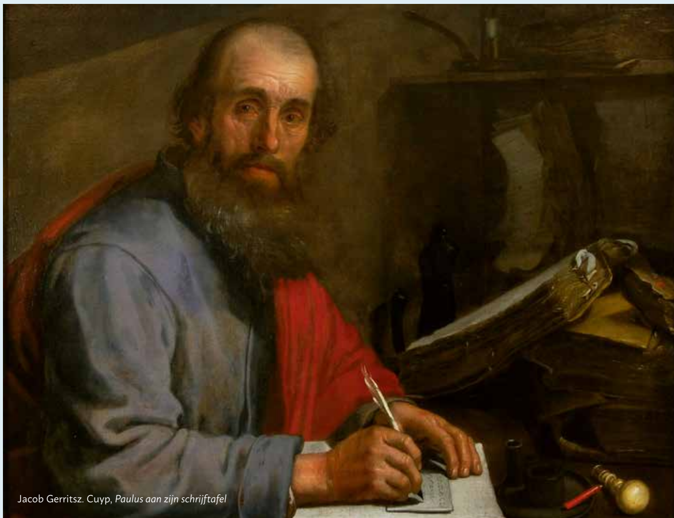
Jacob Gerritsz. Cuyp, Paulus aan zijn schrijftafel