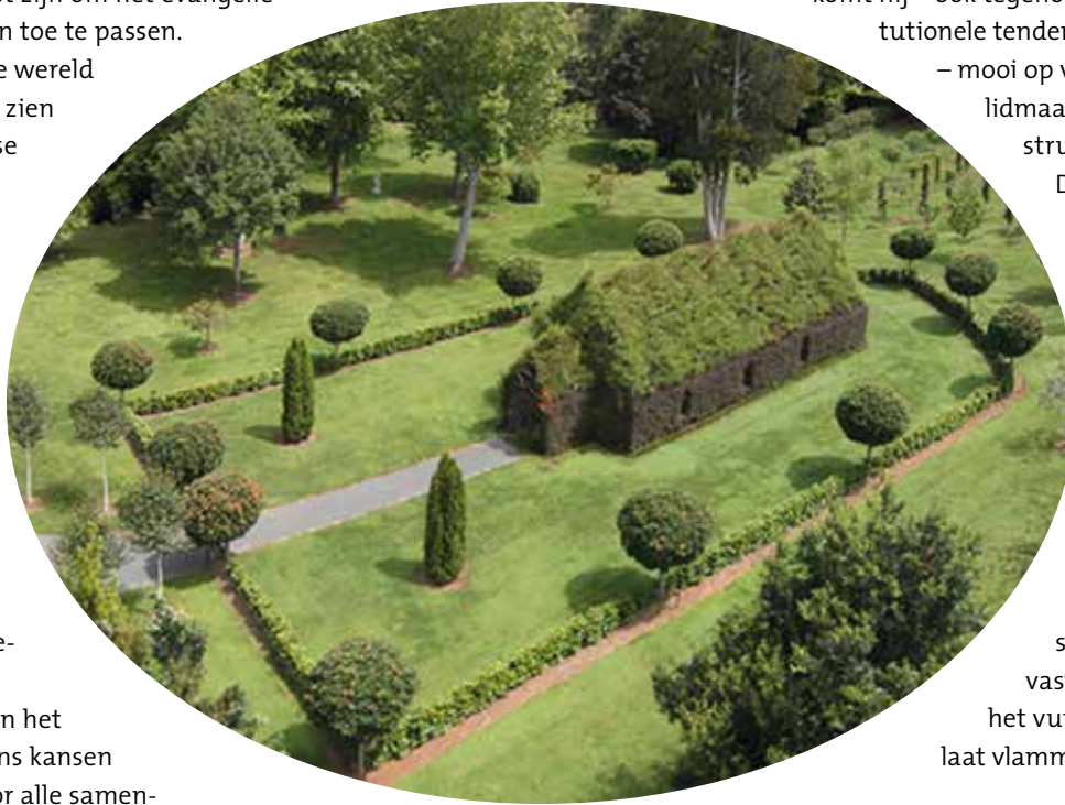
Kerk als organisme...

dan het middel (de plaatselijke kerk). Van daaruit komt hij tot een beweging van kerken in de stad. En de basis is Kellers visie zoals verwoord in Centrum kerk . Ik wreef wel even mijn ogen uit