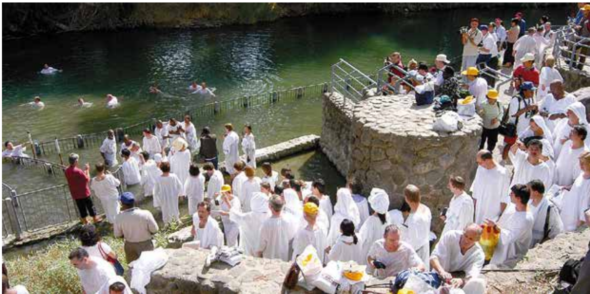
Doopplechtigheid bij de Jordaan