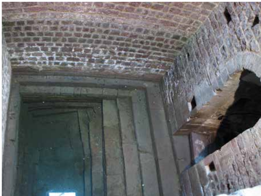
Een mikve, Joods ritueel bad

Voor de doop van Johannes zou op zich dus gedacht kunnen worden aan een achtergrond in de wassingen of reinigingen van het oude verbond. Maar daarmee is de christelijke doop die wij nu kennen, nog niet verklaard. Want de door Christus ingestelde doop is een andere dan die van Johannes. De doop die Christus in Matteüs 28 instelde, is er niet voor de voorbereiding op de ontmoeting met Hem. De instelling daarvan vindt immers plaats ná de komst en het werk van Christus. Het is ook een doop die in de Bijbel uitdrukkelijk wordt onderscheiden van de doop van Johannes: Johannes doopte met water, Christus doopt met de Geest (Luc. 3:16-17; Hand. 1:5; 19:1-4). Johannes onderscheidt zichzelf ook expliciet van Hem die na hem komt.