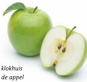
Het klokhuis van de appel

Zo staat het ook met ons leven uit de Geest die ons geschonken is. Wil dat opbloeien en groeien, dan is onze gebedsactiviteit onmisbaar. In het verbond geldt de regel dat de Here zijn gaven alleen geeft aan hen die Hem daarom van harte gelovig vragen (vgl. Mat. 7:7).