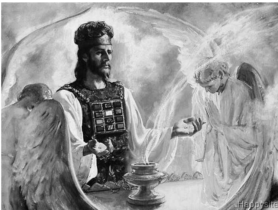
Hogepriester bij de ark

Wie zich een beetje verdiept in de literatuur van charismatische christenen, weet dat er een vorm van charismatische spiritualiteit bestaat die weinig weet van de zondigheid van de mens, en van het gebed van de tollenaar (Luc. 18:13) of van de houding van Psalm 32 of 51. Het geestelijk leven laat vooral uitkomen dat jij er mag zijn, en dat jij belangrijk bent. De stappen die jij zet op de weg van