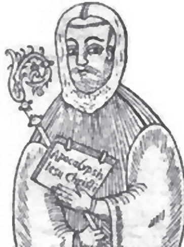
Joachim van Fiore

Het lijkt alsof na de pinksterbeweging, die haar zegetocht precies een eeuw geleden begon vanuit Los Angeles, en na de charismatische opschudding van het bed van de kerk in de jaren zestig - eerst onder protestanten, later ook in de Rooms-katholieke Kerk - er nu een charismatische intocht in de orthodox-gereformeerde kerken wordt ingezet. Gereformeerde bonders, vrijgemaakt-gereformeerden, Nederlands gereformeerden, christelijk-gereformeerden stemmen samen, o.a. rondom het