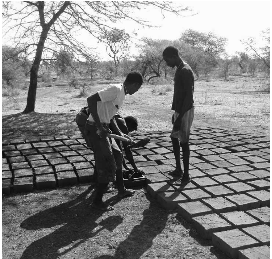
Afrika: bouwen met leem